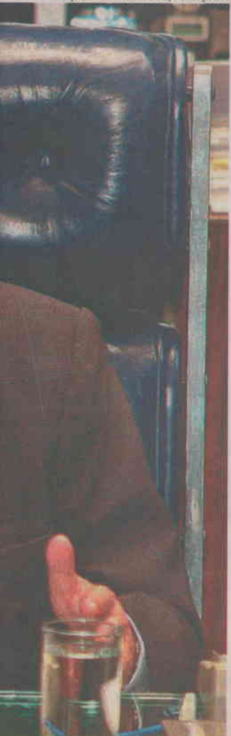
ção de votação do plenário

União), afirma ser “natural que os problemas sejam maiores nos municípios”, tanto pela estrutura quanto pelos recursos disponíveis.