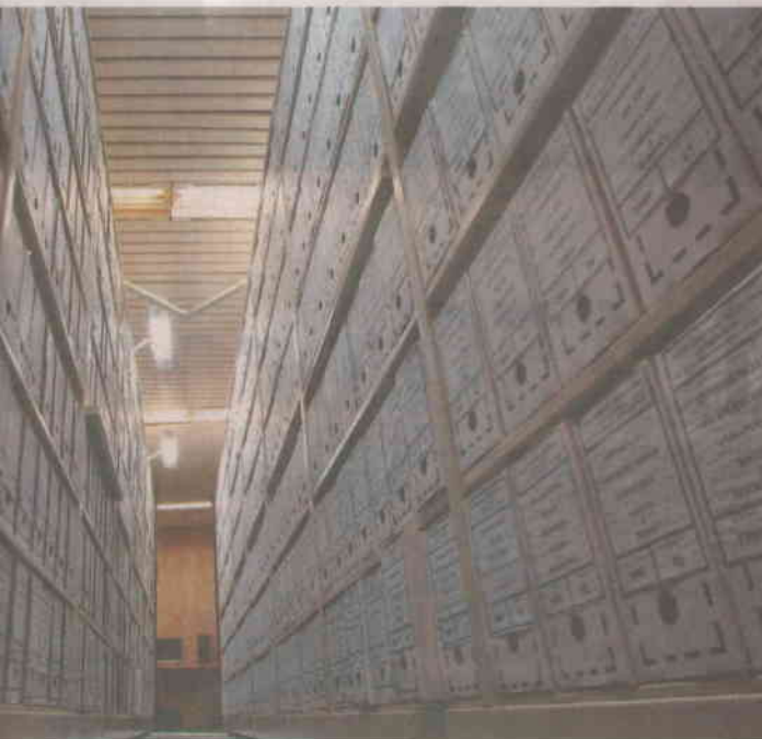
Alan Marques - 26 ago. 11 / Folhapress

documentos confidenciais no Itamaraty, em Brasília